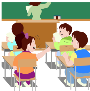
ГРАФИК ЗАНЯТОСТИ КАБИНЕТА № 407 В 1 СМЕНУ